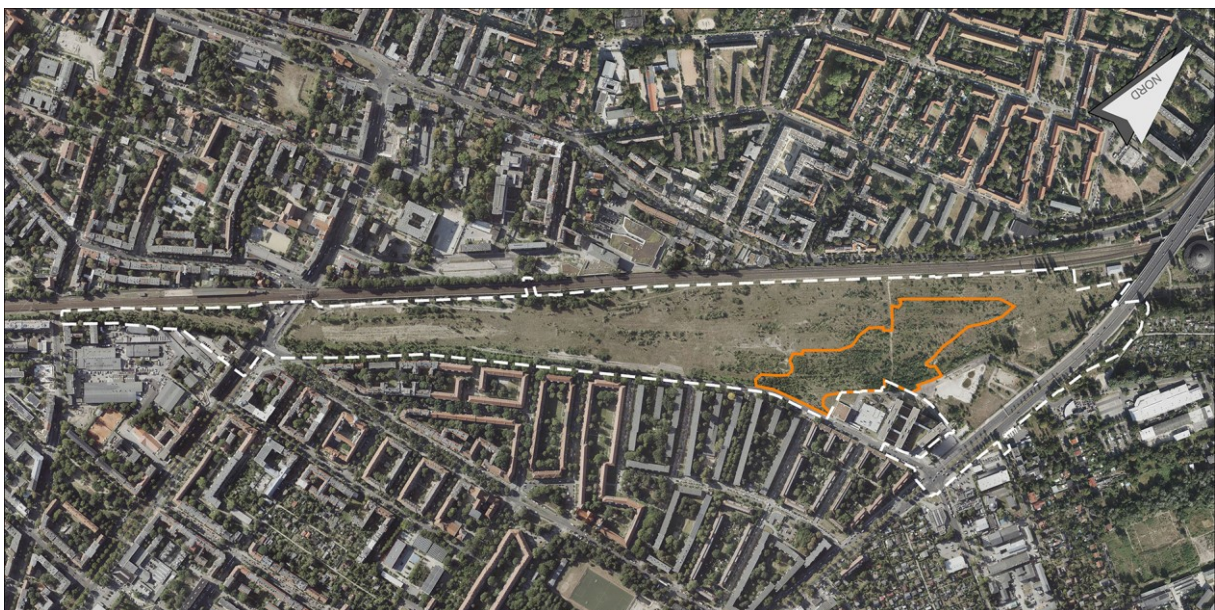
Abbildung 1: Waldfläche nach Landeswaldgesetz im Geltungsbereich des B-Plans 3-60a

Zur Ermittlung des Kompensationsbedarfs für die umzuwandelnde Waldfläche wird im Folgenden eine Bilanzierung nach methodischer Vorgabe des aktuellen gültigen Waldleitfadens Berlin (Stand: Mai 2020) vorgenommen.