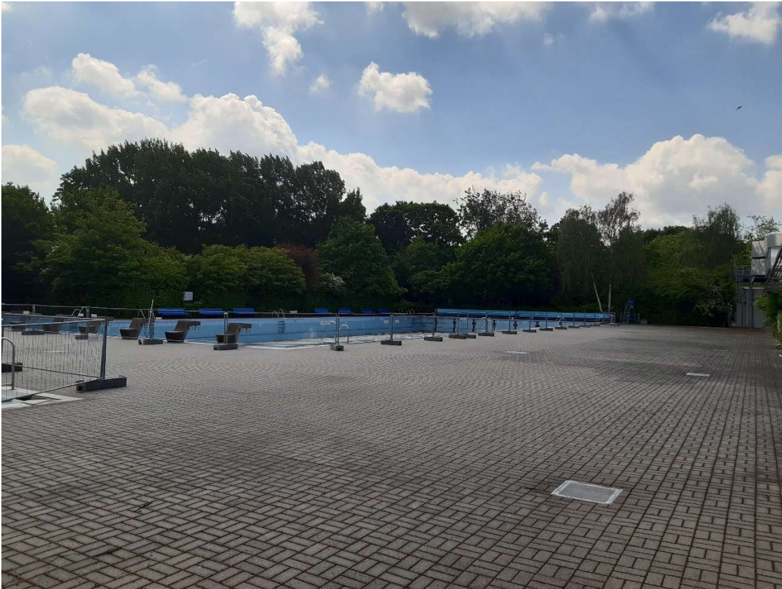
Abbildung 1: Blick auf die Außenbecken in Richtung Südosten