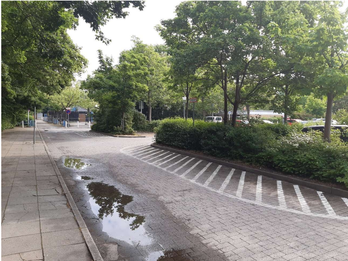
Abbildung 3: Blick von den Parkplatzflächen nach Norden zur Schwimmhalle