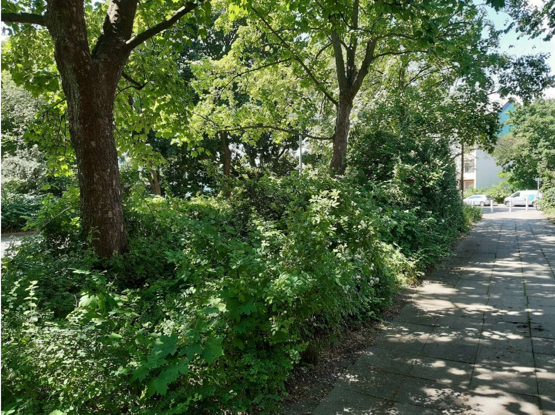
Abbildung 5: Blick vom Parkplatz in Richtung Ankogelweg