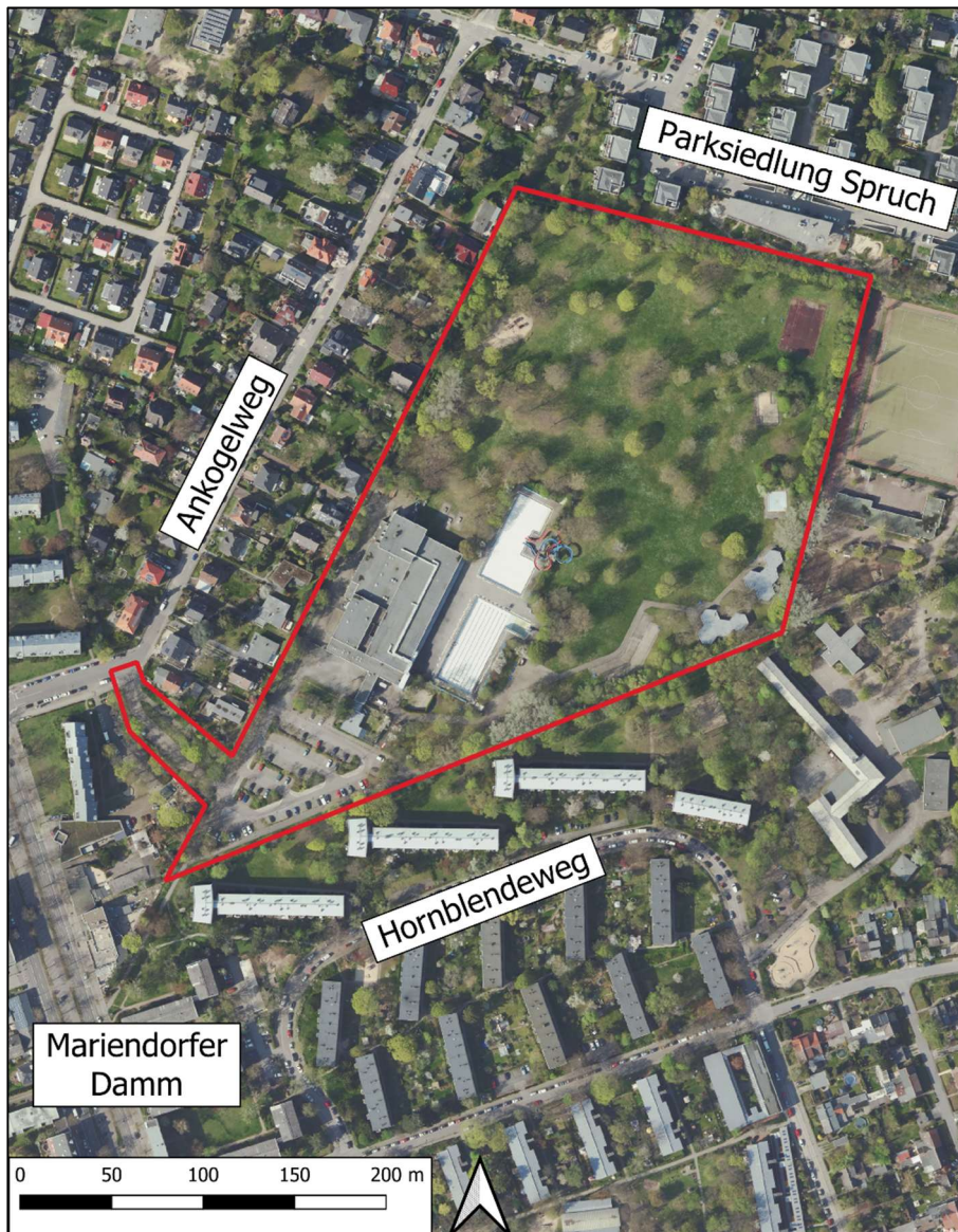
Abbildung 1: Übersicht über das Plangebiet (Geltungsbereich in rot)

Kartengrundlage: Geoportal Berlin / DOP20RGBI (Digitale farbige TrueOrthophotos 2023)