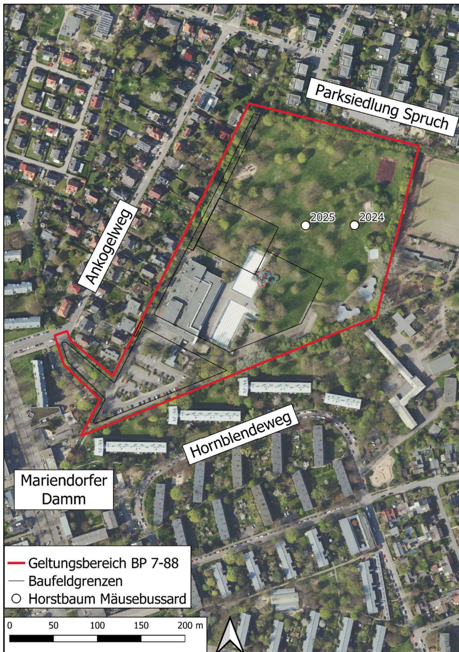
Abbildung 2: Horststandorte innerhalb des Plangebietes des BP 7-88

Bei ersten faunistischen Kartierungen zum Bebauungsplan im Jahr 2018 wurde der Mäusebussard noch nicht festgestellt (BPR 2018). Im Zuge erneuter faunistischer Kartierungen 2024 wurde innerhalb des Geltungsbereiches des Bebauungsplans ein Horst des Mäusebussardes, auf einer Birke (Plakettennummer 000252), im östlichen Teil der Liegewiese festgestellt. Im Jahr 2025 wurde durch die Stadtnatur-Ranger ein zweiter Horststandort in einem Spitzahorn identifiziert.