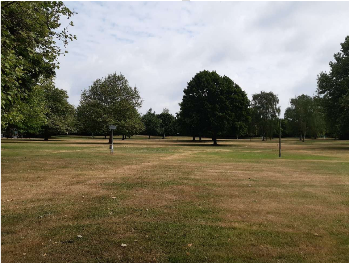
Abbildung 2: Blick auf die intensiv gepflegte Liegewiese nach Norden