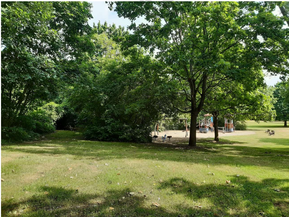
Abbildung 4: Blick auf die Spielplatzfläche nördlich der Schwimmhalle