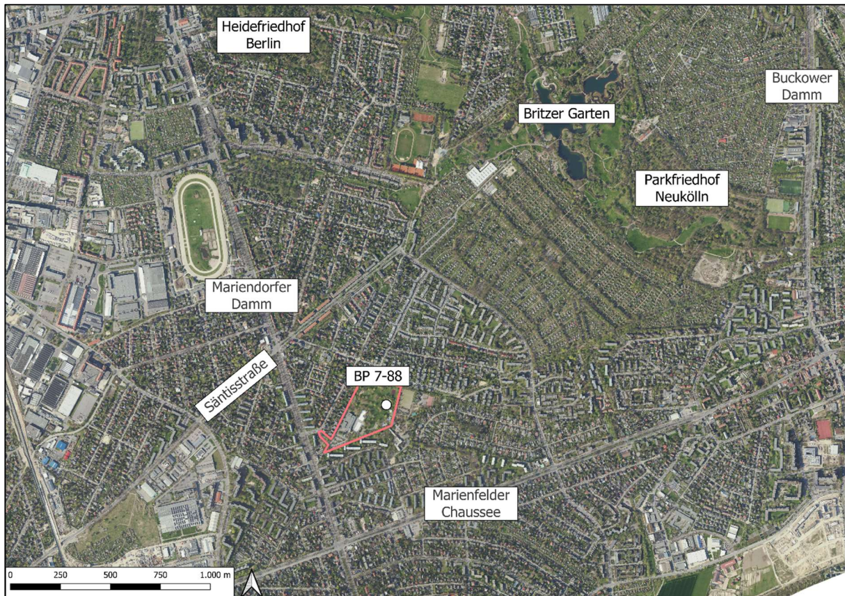
Abbildung 3: Umgebung der im BP 7-88 festgestellten Mäusebussardhorste

Horststandorte als Punkt, Geltungsbereich BP 7-88 als rote Linie